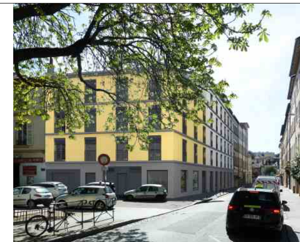
1 Rue de la Favorite 69005 LYON